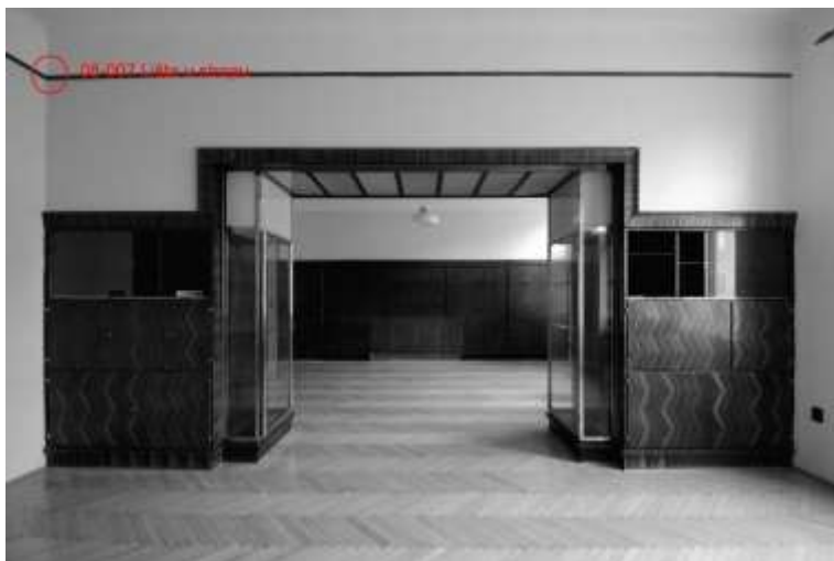
Odběrová mapa lišty