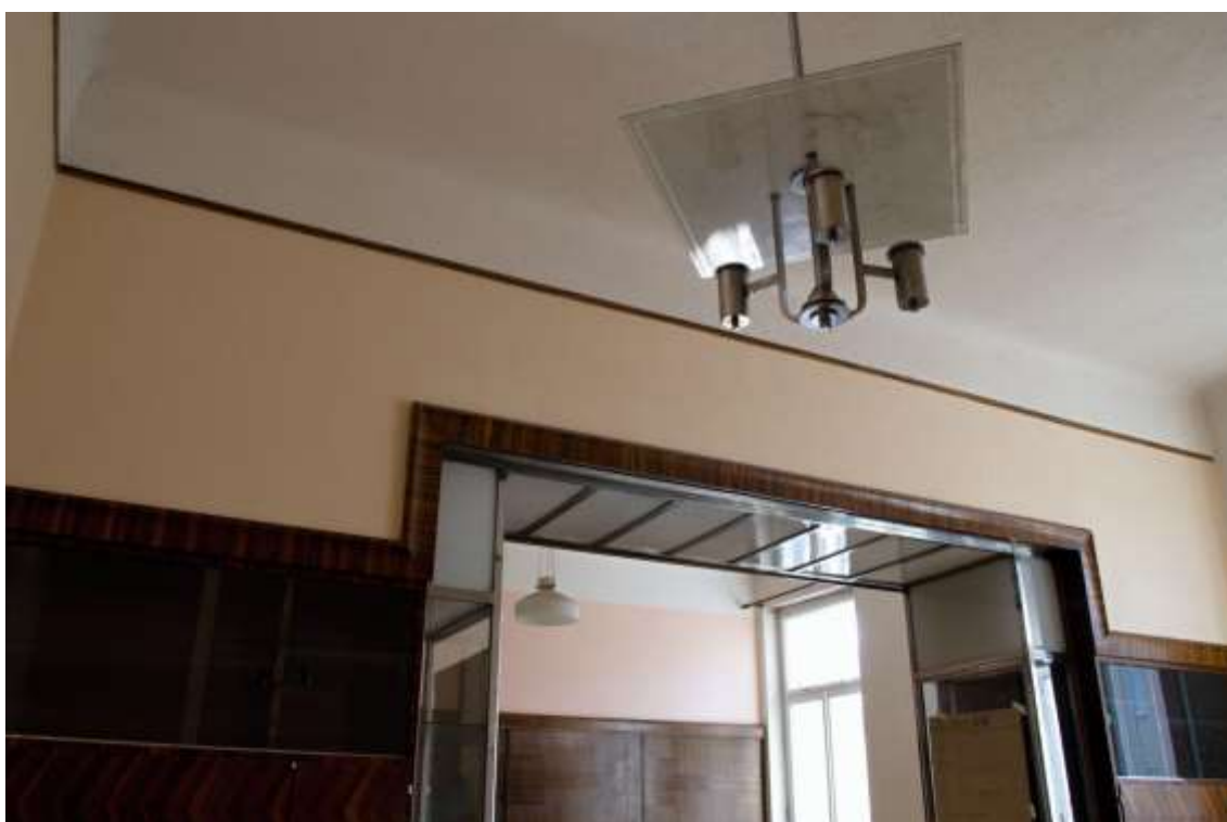
Pohled na východní stěnu