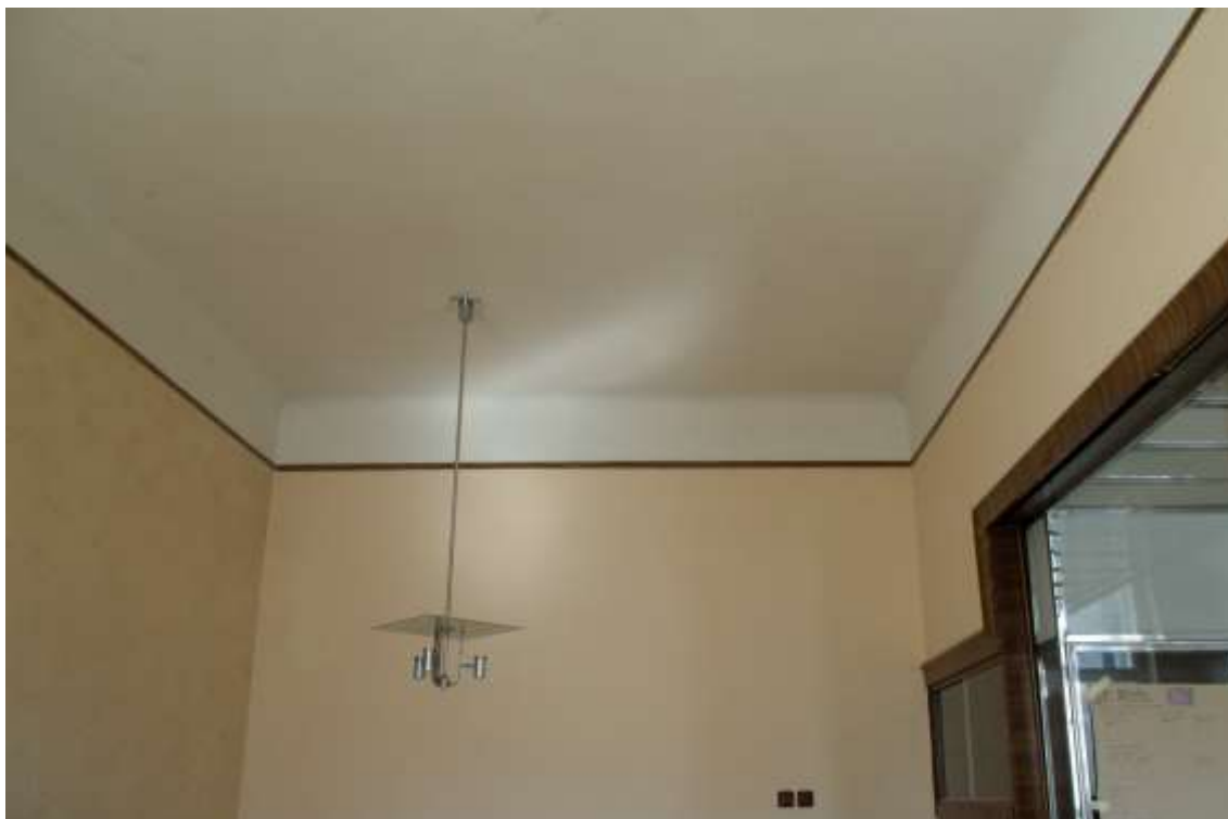
Pohled na severní stěnu